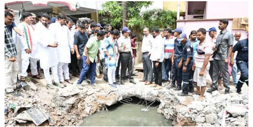
వాస్తవం : జూబ్లీహిల్స్

క్షేత్రస్థాయిలో పరిశీలించిన జూబ్లీహిల్స్ ఎమ్మెల్యే, జిహెచ్ఎంసి కమిషనర్, హైద్రా కమిషనర్