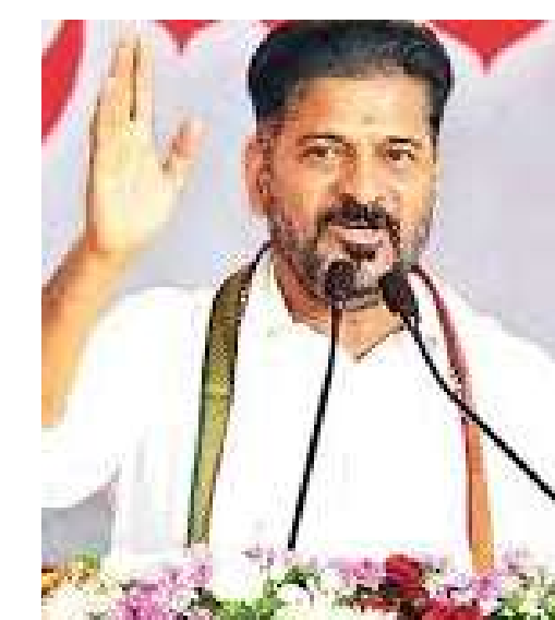
పెట్టాలని.. అభివృద్ధికి బాటలు వేద్దామని పిలుపునిచ్చారు. కొడంగల్ ను ఆదర్శవంతంగా తీర్చిదిద్దుకుందామని సీఎం రేవంత్ రెడ్డి పేర్కొన్నారు.

అనుమతులు వచ్చాయని, ఏడాది న్నరలోపు పూర్తి చేద్దామని చెప్పుకొచ్చారు. కృష్ణ-వికారాబాద్ రైల్వేలైన్ త్వరలో పూర్తవుతుందని స్పష్టం చేశారు. రేకులపాడు ప్రాంతంలో సిమెంట్ పరిశ్రమలను ఆరు నెలల్లో ఏర్పాటు చేసి ఉపాధి కల్పిస్తామని అన్నారు. 220 ఎకరాల్లో లగచర్ల వద్ద విద్యాహబ్ గా మారుస్తున్నామని సీఎం రేవంత్ రెడ్డి ఉద్ఘాటించారు. ఇక్కడ అనేక విద్యా సంస్థలు ఏర్పాటు చేస్తున్నామని వెల్లడించారు. రాజకీయాలు ఎన్నికల సమయంలో ఉండాలని.. ఆ తర్వాత అందరం కలిసి పనిచేయాలని సూచించారు. 2034 వరకు గుంపులు, గ్రూపులు పక్కన