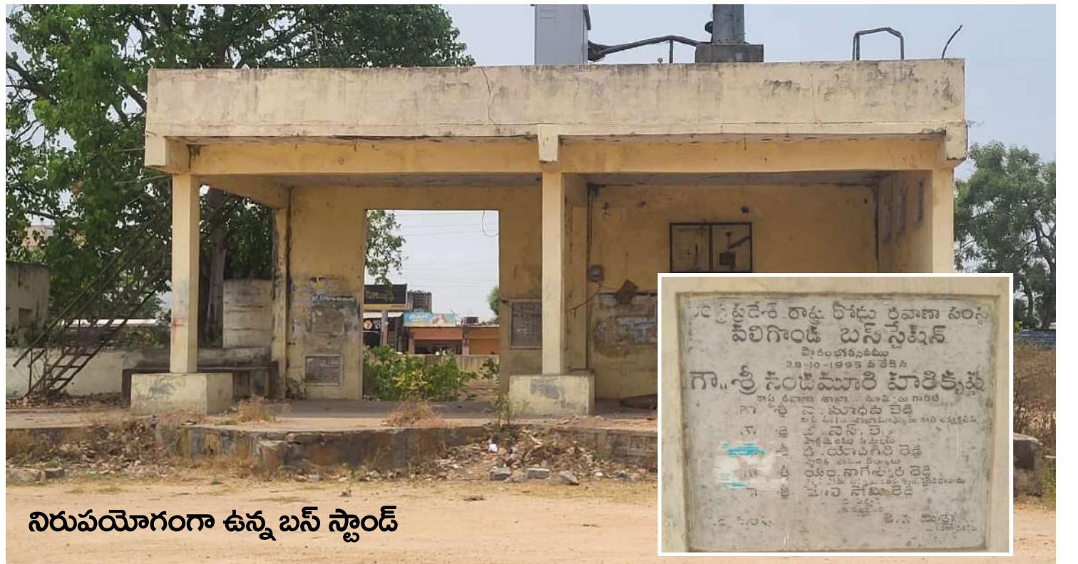
నిరుపయోగంగా ఉన్న బస్ స్టాండ్

లు చాలాసార్లు తీసుకెళ్ళినా ప్రయోజనం శూన్యం. కనీసం ఒక చిన్న తడకలతో తాత్కాలికంగా షెడ్డును నిర్మించి ప్రయాణీకులకు రక్షణ కల్పించాలని వారు వాపోతున్నారు. పట్టణ కేంద్రంలో ప్రయాణీకులు ప్రతి రోజు బస్ కోసం ఎదురుచూసే వద్ద కనీసం చలివేంద్ర కేంద్రాలు కూడా నిర్మించలేదు. ఎండ తీవ్రతకు తట్టుకోలేక నిరుపేదలు నీరు కొనుక్కొని దప్పిక తీర్చుకునే స్థామత లేక ఇబ్బందులు పడుతున్నాయి. నీడకోసం దుకాణాల వద్ద సేదతిరాలి అనుకుంటే దుకాణ యజమానులు తమ విక్రయానికి ఇబ్బందిగా ఉంది అని అసహనం వ్యక్తం చేస్తున్నారు. గతంలో రోడ్డు ఇరువైపులా చెట్లు ఉండడంతో చెట్ల కింద ప్రయాణీకులు నిలబడి బస్సు వచ్చినప్పుడు ఎక్కి వెళ్లేవారు. ఇప్పుడు రోడ్డు వెడల్పు నిర్మాణం జరుగుతున్న క్రమంలో చెట్లను సరికి వేయడం వలన ప్రయాణీకులకు ఎక్కడా నీడ లేకుండా పోయింది. రోజురోజుకు పెరుగుతున్న ట్రాఫిక్ సమస్యలు ప్రజలకు తీవ్ర ఇబ్బందులను కలిగిస్తోంది. రోడ్ల విస్తరణ పనులు ఆలస్యం అవ్వడంతో పార్కింగ్ సమస్యలతో పాటు రోడ్డుపైనే ఆర్టీసీ బస్సు ఆపి ప్రయాణీకులను ఎక్కించుకున్నంత వరకు బస్సు వెనకాల ఎదురుగా వాహనాలు నిలిచి ట్రాఫిక్ నియంత్రణ లేకుండా పోయింది. ఆర్టీసీ వాళ్లే చొరవ తీసుకొని బస్టాండ్ను ఉపయోగంలో తీసుకువస్తే ప్రయాణీకులకు, దుకాణ దారులతో పాటు నిరుద్యోగులకు కూడా బస్ స్టాండ్లో చిరు వ్యాపారాలు చేసుకోవడానికి అన్ని విధాలా ప్రయోజనంగా ఉంటుందని పట్టణ ప్రజలు కోరుతున్నారు.