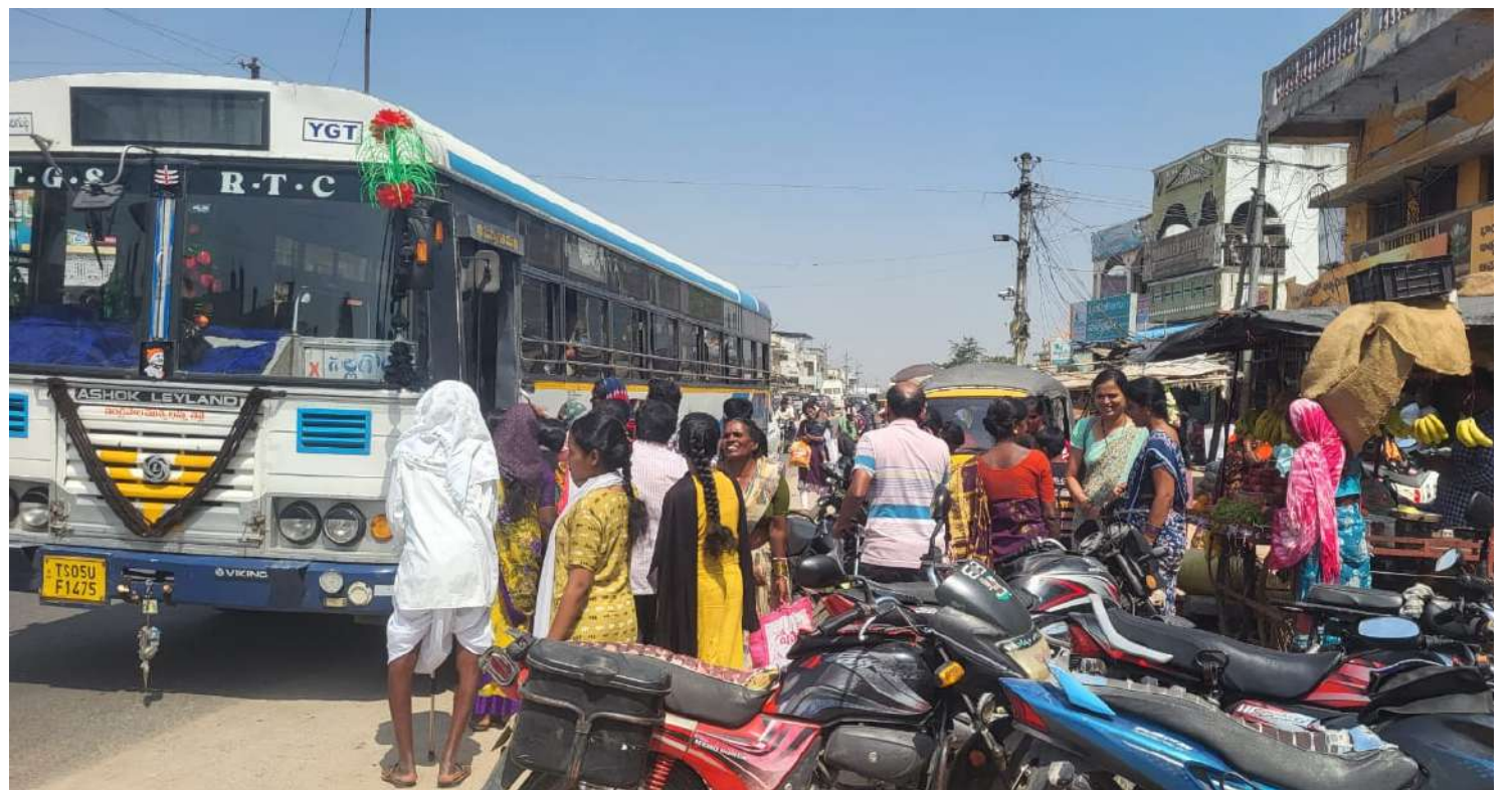
మండుతున్న ఎండలో ప్రయాణీకుల అరిగోస