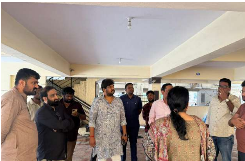
వాస్తవం : జూబ్లీహిల్స్