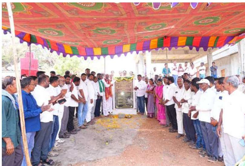
లో ప్రజా ప్రతినిధులు, అధికారులు, కాంగ్రెస్ పార్టీ నాయకులు, కార్యకర్తలు, గ్రామస్థులు పాల్గొన్నారు.