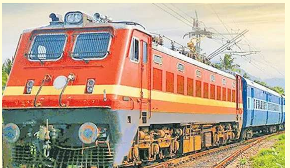
ప్రత్యేక రైళ్లు రెగ్యులర్ రైళ్లుగా మారడంతో ప్రయాణికులపై అదనపు చార్జీల భారం ఉండదని వెల్లడించారు.

వంటి సుదూరప్రాంతాలకు వెళ్లే ప్రయాణికులకు లబ్ధి చేకూరనుంది. రైల్వే శాఖ నిర్ణయం పట్ల ఎక్స్ వేదికగా కేంద్ర మంత్రి కిషన్రెడ్డి హార్బం వ్యక్తం చేశారు. ప్రధాని మోదీ, రైల్వే మంత్రి అశ్వినీ వైష్ణవ్కు ధన్యవాదాలు తెలియజేశారు. కాగా ఇప్పటికే ఈ ప్రత్యేక రైళ్లు ఆయా ప్రాంతాల నుంచి నడుస్తున్నాయని, ఈ ప్రత్యేక రైళ్లను రెగ్యులర్ రైళ్లుగా మార్చాలని రైల్వేశాఖ నిర్ణయించిందని రైల్వే అధికారులు పేర్కొన్నారు. ఈ