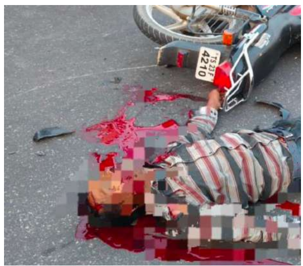
ట్రాఫిక్ను క్రమబద్ధీకరించారు. పోలీసులు కేసు నమోదు చేసుకొని దర్యాప్తు ప్రారంభించారు. మృతదేహానికి పంచనామా అనంతరం పోస్టుమార్టం నిమిత్తం ప్రభుత్వ వైద్యశాలకు తరలించారు.

వేములవాడ మున్సిపల్ పరిధిలోని నాంపల్లి శివారులో బుధవారం ఉదయం ఘోర రోడ్డు ప్రమాదం చోటుచేసుకుంది. కరీంనగర్ సిరిసిల్ల ప్రధాన రహదారిపై వేగంగా వచ్చిన లారీ బైకును బలంగా ఢీ కొట్టింది. ఈ ప్రమాదంలో బైక్ పై ప్రయాణిస్తున్న వ్యక్తి తీవ్ర గాయాలతో అక్కడికక్కడే ప్రాణాలు కోల్పోయాడు. మృతుడుని బోయినపల్లి మండలం విలాసాగర్ గ్రామానికి చెందిన వ్యక్తిగా పోలీసులు గుర్తించారు. ఉదయాన్నే ఈ ప్రమాదం జరగడంతో స్థానికంగా విషాదం నెలకొంది. సమాచారం అందుకున్న పోలీసులు వెంటనే ఘటన స్థలానికి చేరుకొని