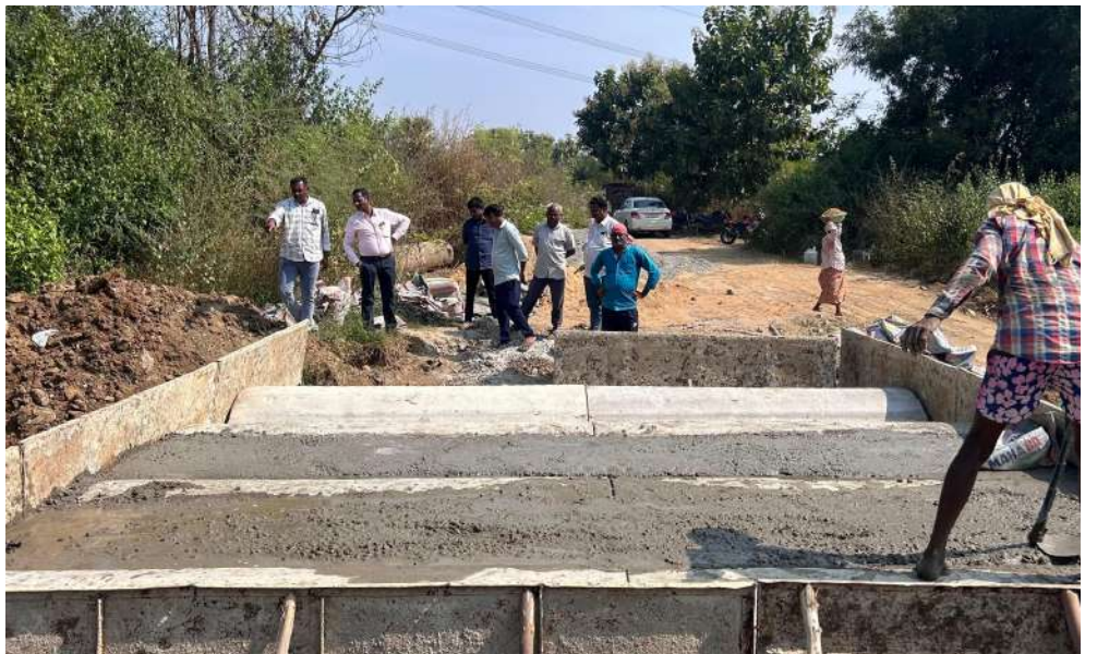
కారకులొతున్నారు. ఇప్పటికైనా.. జిల్లా కలెక్టర్ ఈ విషయంపై పూర్తి వివరాలను ఆరాధిసి పేద మేస్త్రి దీని గాధను పరిగణలోకి తీసుకొని, వాస్తవాన్ని గ్రహించి, పేద మేస్త్రికి తను కల్వర్టు నిర్మాణానికి పెట్టిన 1,80,000 రూపాయల ఖర్చును అందించి న్యాయం చేయాలంటూ.. అభిప్రాయపడుతున్నారు. లేని పక్షంలో ఎంపీడీవో, కలెక్టర్ కార్యాలయాల ముందు మేస్త్రి కుటుంబ సభ్యులు ధర్నా చేయవలసి ఉంటుందని గ్రామస్తులు హెచ్చరిస్తున్నారు.