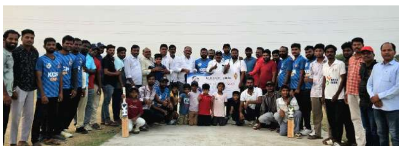
వాస్తవం : ఎల్లారెడ్డిపేట

ఎల్లారెడ్డిపేట మండల కేంద్రంలో నిర్వహించిన కేసీఆర్ కవ్ క్రికెట్ టోర్నమెంట్లో దుమాల గ్రామానికి చెందిన జట్టు విజయం సాధించింది. మూడు రోజుల పాటు ఉత్సాహంగా సాగిన ఈ పోటీల్లో పది రా జట్టుతో జరిగిన ఫైనల్ మ్యాచ్లో దుమాల జట్టు గెలుపొందింది. విజేత జట్టుకు మండల నాయకులు మొదటి బహుమతిని అందజేశారు. ఈ సందర్భంగా క్రీడాకారులు మరియు జట్టు పోటీలను విజయవంతంగా నిర్వహించిన నిర్వాహకులకు కృతజ్ఞతలు తెలిపారు.