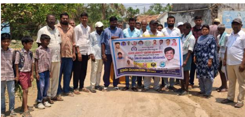
వాస్తవం : జైపూర్