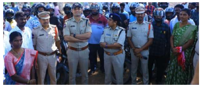
యమాలు పాటించాలని, హెల్మెట్ ధరించడం వల్ల ప్రాణాపా