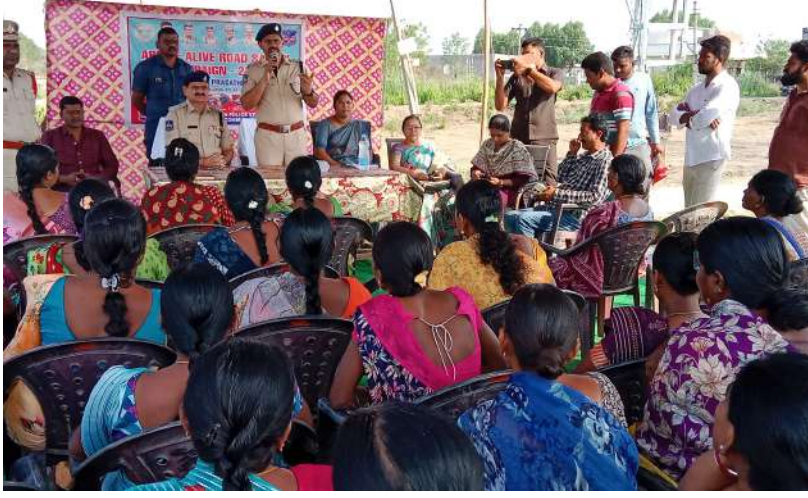
వాస్తవం : రామగిరి