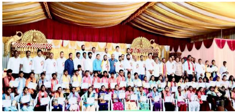
వాస్తవం : వేములవాడ

ముదిరాజు జిల్లా సంక్షేమ సంఘం ఆధ్వర్యంలో వేములవాడ మండలం అగ్రహారం లోని శ్రీ కన్వెన్షన్ లో సోమవారం పదవ తరగతి, ఇంటర్ ఫలితాల్లో ప్రతిభ చూపిన ఆణిముత్యాల ఆత్మీయ అభినందన సన్మాన కార్యక్రమం నిర్వహించారు. ఈ కార్యక్రమంలో ముదిరాజు జిల్లా అధ్యక్షులు, ఉపాధ్యక్షులు, సర్పంచ్ లు, మండలశాఖ, గ్రామశాఖ అధ్యక్షులు, ఉపాధ్యక్షులు, ప్రముఖ ఎన్ఆర్ఐ లు, కుల పెద్దలు, కుల బంధువులు పాల్గొన్నారు. ముదిరాజు విద్యార్థిని విద్యార్థులను ప్రోత్సహిస్తూ వాళ్ళకు మనో ధైర్యాన్ని కల్పించి ముందుకు నడిపించాలని కోరారు.