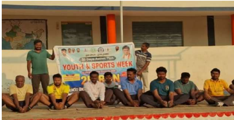
ముఖ్య అతిథిగా హాజరై మాట్లాడుతూ- యువత ఆరో