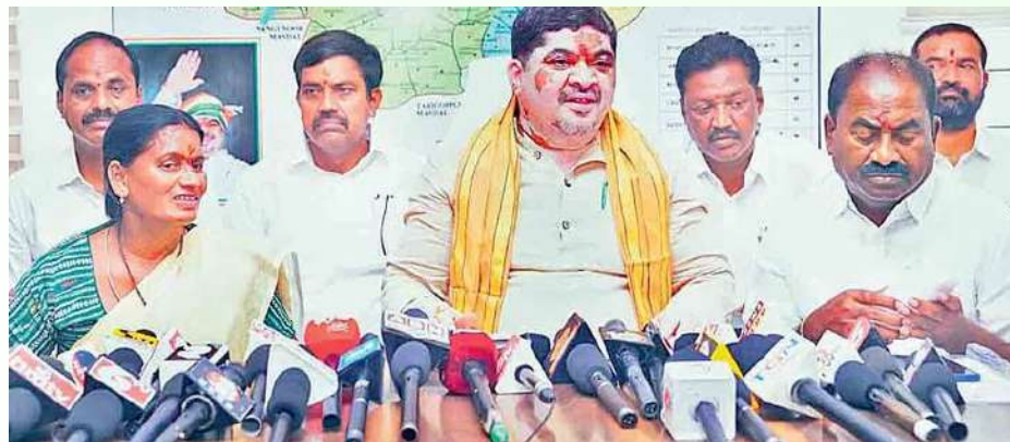
లో పెట్రోల్, డీజిల్ ధరలు పెరుగుతుంటే ప్రజలకు పవన్ కల్యాణ్ క్షమాపణలు చెప్పాలని మాట్లాడకుండా తెలంగాణపై విషం కక్కుతున్నాడని విమర్శించారు. తక్షణమే తెలంగాణ

వాన్ని దెబ్బతీసేలా మాట్లాడిన పవన్ కల్యాణ్ తెలంగాణ అవిర్భావ దిన సభరోజున నవనిర్మాణ సభను ఎందుకు నిర్వహిస్తున్నారని ప్రశ్నించారు. డబ్బులు ఇస్తే ఎలాంటి నటననైనా చేసే పవన్ కల్యాణ్ తెలంగాణపై నోరుపారేసుకుంటున్నారని విమర్శించారు. తెలంగాణ ప్రజలకు క్షమాపణ చెప్పిన తర్వాతే నవనిర్మాణ సభను నిర్వహించాలని డిమాండ్ చేశారు. బీజేపీకి తెలంగాణను తాకట్టు పెట్టేందుకే నవనిర్మాణ సభను ఇక్కడ నిర్వహిస్తున్నారా అని ప్రశ్నించారు. తెలంగాణ డ్యూటీ పవన్ కల్యాణ్ విద్యేష రాజకీయాలు చేస్తే సహించేదేదని, బీజేపీ పప్పులు ఇక్కడ ఉడక వనే విషయాన్ని గుర్తుంచుకోవాలన్నారు. దేశం