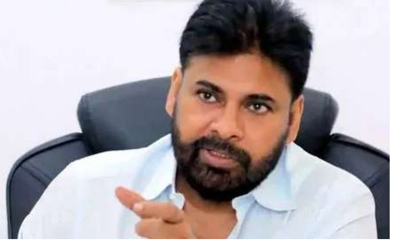
చెప్పలేక, ప్రజల దృష్టిని మళ్లించడానికి పవన్ కళ్యాణ్ అనే సెంటిమెంట్