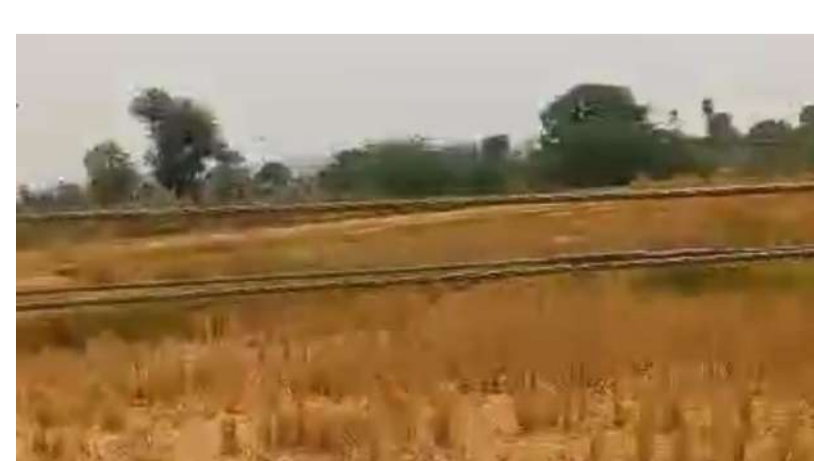
దించి వెంటనే వైర్లను క్లియర్ చేయగలరని రైతులు కోరుకుంటున్నారు.

వాస్తవం : ఎల్లారెడ్డిపేట ఎల్లారెడ్డిపేట నారాయణపురం గ్రామంలో. మండలంలో ప్రమాదకరంగా మారిన నారాయణపురం త్రిపిస్ వైర్లు లూజు కలెక్షన్తో కిందికి వేలాడుతున్నాయి ప్రమాదాలు జరిగిన తర్వాత బాధపడితే లాభం లేదు వెంటనే సంబంధించిన అధికారులు ఏవి వెంటనే స్పందించి తగిన చర్యలు తీసుకోగలరు ప్రమాదాలు జరిగే అవకాశాలు ఉన్నాయి గొర్రెలు మేకలు బర్లు నేతలకు పోయే ప్రమాదం ఉంది ప్రమాదవశాత్తుగా చనిపోతే లక్షల నష్టం జరుగుతుంది కావున వెంటనే ఎలక్ట్రికల్ లైన్మెన్లు స్పం