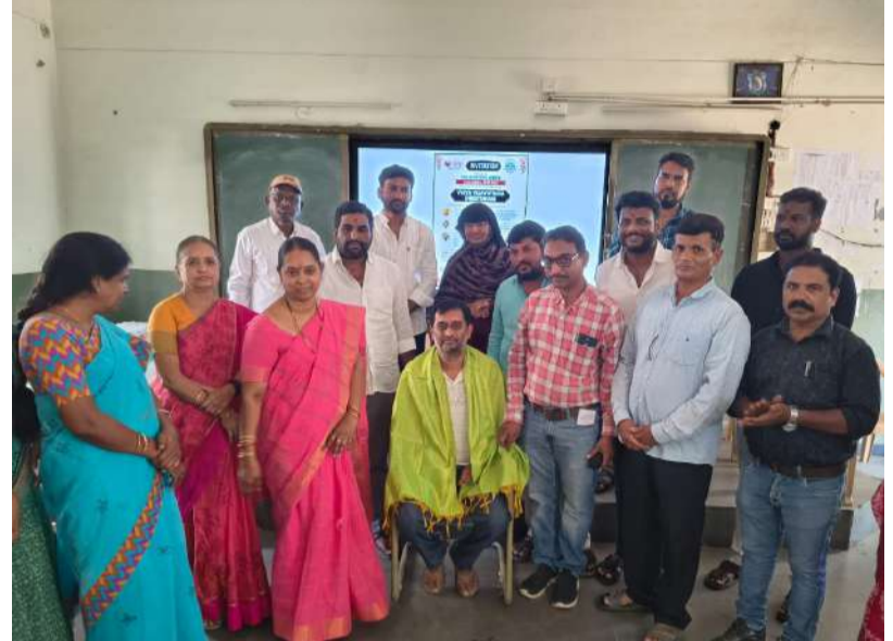
మీ ఇచ్చారు. ఈ కార్యక్రమంలో గ్రామ పంచాయతీ పాలకవర్గ సభ్యులు, ఉపాధ్యాయులు, విద్యార్థులు, తదితరులు పాల్గొన్నారు..